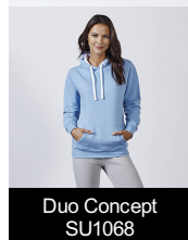
Dúo Concept SU1068